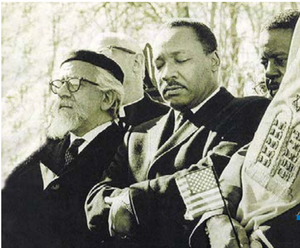
Rabbin Abraham Joshua Heschel en Rev. Martin Luther King

Over het vasten van Tisja Be'av, de dag waarop de vernietiging van beide Tempels wordt herdacht, stelde hij