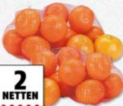
Mandarijnen uit Spanje 2 netten à 1 kilo