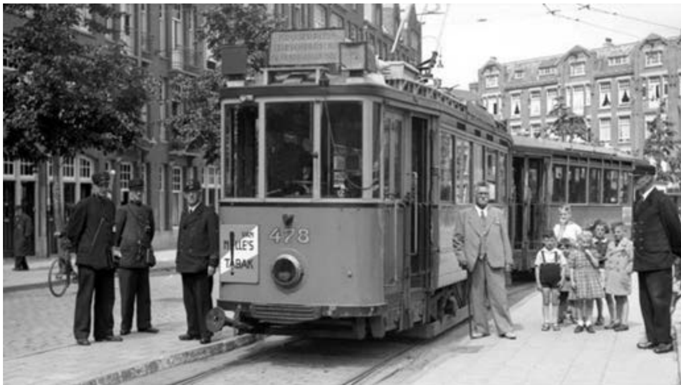
Amsterdams vervoerbedrijf GVB maakt gebaar vanwege rol bij deportaties in WOII