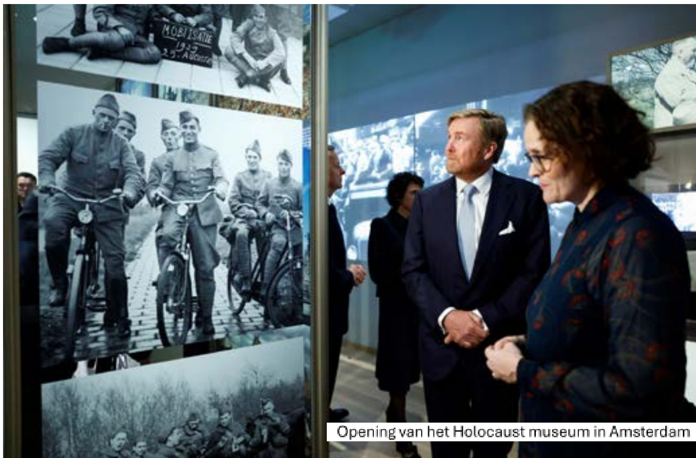
Opening van het Holocaust museum in Amsterdam

Opvallend was een demonstratie van pro-Palestijnse