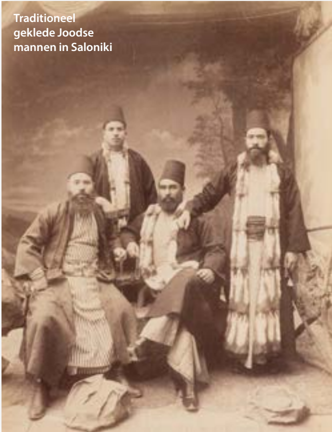
Traditioneel geklede Joodse mannen in Saloniki

in Saloniki vestigen, in een eigen wijk met moskee. De Ottomaanse overheid verdacht hen ervan crypto-Joden te zijn, aangeduid met de naam 'domne' zoals in Spanje marranen bestonden.