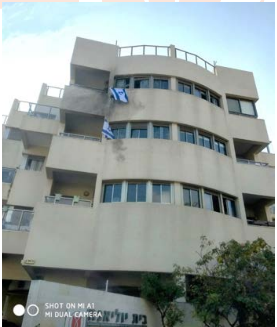
De schade aan het gebouw

Jom Kipoer (ze hebben een speciale voorzanger voor deze dag) om negen uur naar bed ging en vervolgens werd gewekt door een luchtalarm. Ze werden geëvacueerd voor een paar uur. Er was onderzoek nodig en verdere afhandeling van de veroorzaakte schade. Er heerste vooral grote schrik, maar vader vertelde dat hij verder gewoon is doorgegaan met vasten, tot het einde van de