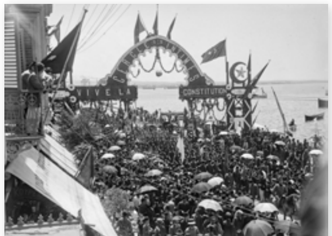
Eerste verjaardag van de revolutie der 'Jong Turken'

Er waren echter ook tekenen van naderend onheil. Het Ottomaanse rijk verloor geleidelijk aan zijn macht en moest onder druk van het opkomend nationalisme