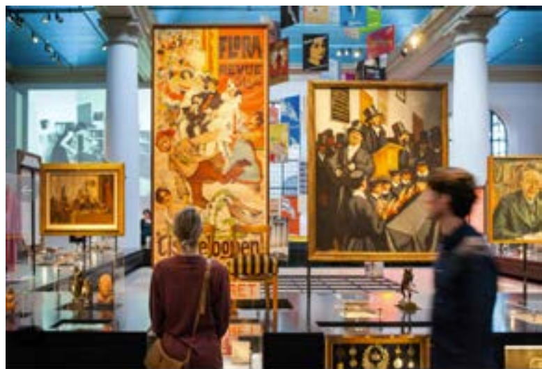
Tentoonstelling in 't Joods museum

In november opende het Joods Museum een tentoonstelling over hoe het omgaan met seksualiteit binnen het Jodendom. Enigszins ondeugend draagt de expositie de titel 'Sex: Jewish Positions.' De plicht tot het krijgen van (veel) kinderen ging in het Jodendom altijd gepaard met plezier voor huwelijkspartners, aldus de organisatoren.