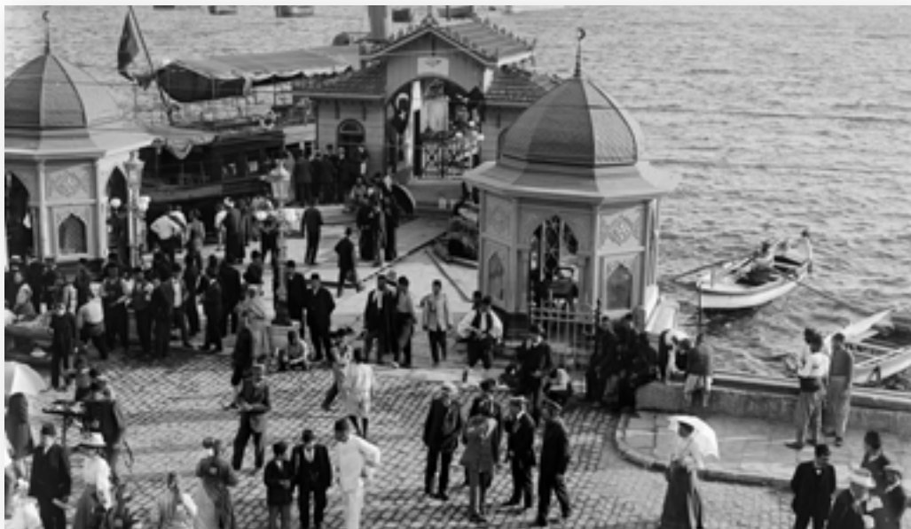
Haven van Saloniki