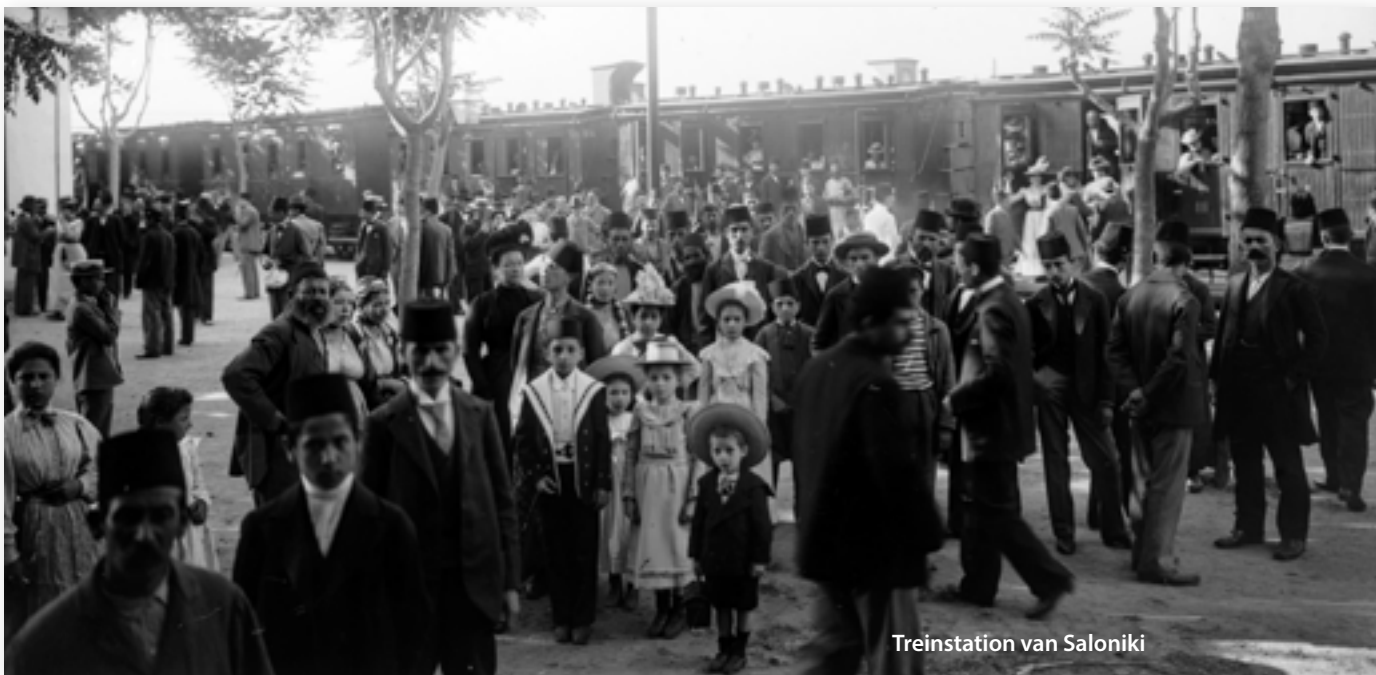
Treinstation van Saloniki

Begin 1943 concentreerden de Duitsers de ongeveer 50.000 Joden van Saloniki in twee getto's. Vandaaruit volgde van maart tot augustus van dat jaar hun deportatie naar Auschwitz. Uit dit vernietigingskamp keerden amper duizend overlevenden terug. Velen van hen vestigden zich