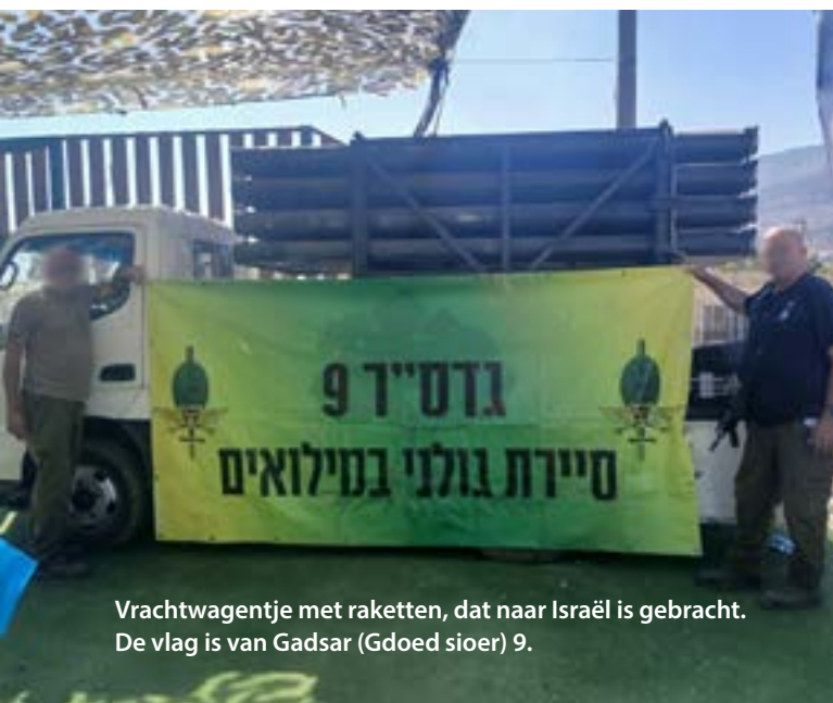
Vrachtwagentje met raketten, dat naar Israël is gebracht. De vlag is van Gadsar (Gdoed sioer) 9.