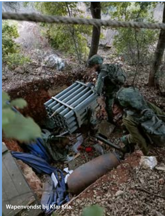
Wapenvondst bij Kfar Kila.