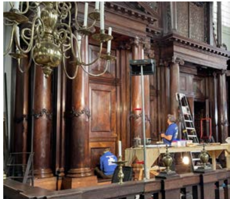
Restauratie van de Snoge

Het 'gebroken spiegel'-monument in het Wertheimpark,