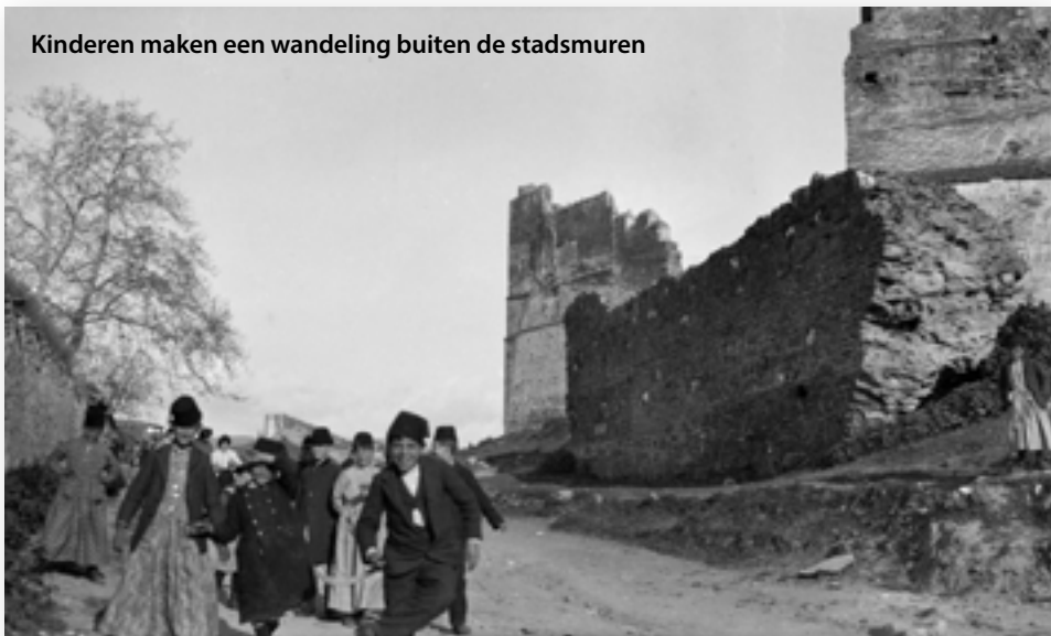
Kinderen maken een wandeling buiten de stadsmuren

Wel vertrokken in deze periode Joden uit Saloniki naar het Britse mandaatgebied Palestina, de Verenigde Staten en Frankrijk. In het laatste land vestigde zich onder meer de grootvader van de Franse politicus Sarkozy.