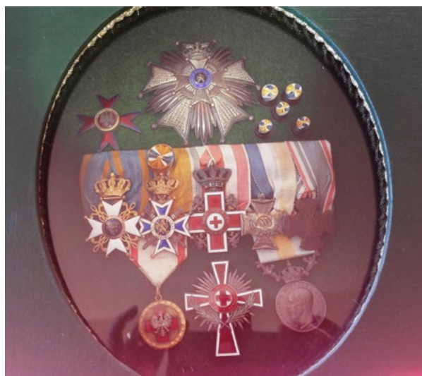
Alle medailles van Nardus Schrijver