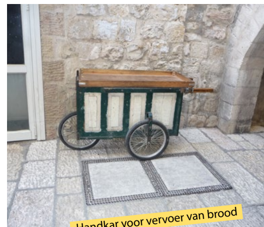
Handkar voor vervoer van brood