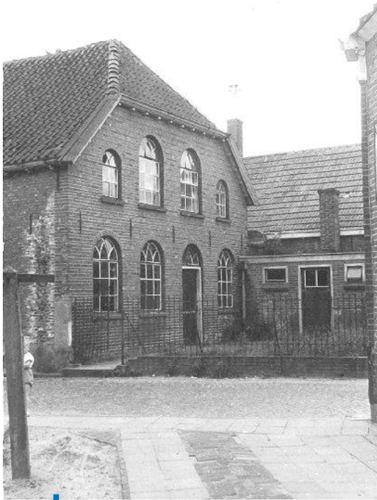
De synagoge van Eibergen

"Eén keer ging ik met de kippendoos naar het station en toen ik de bus wilde instappen vloog de kip uit de doos. Het was echt om te lachen, de chauffeur en diverse passagiers renden achter de kip aan (op een drukke verkeersweg) om hem te pakken. Enfin, hij heeft zijn lot niet gemist."