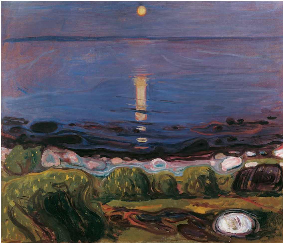
Edvard Munch, Sommernacht am Strand (1902/1903)

Bijna zestig jaar heeft de familie Mahler gestreden voor de terugkeer van het meesterwerk Sommernacht am Strand dat rond 1902 door Edvard Munch werd geschilderd. Het werk was sinds 1916 in het bezit van de weduwe van componist Gustav Mahler, Alma Mahler-Werfel die na Mahlers dood tweemaal hertrouwde, eerst met Walter Gropius, oprichter van de Bauhaus school of design en daarna met de Joodse schrijver Franz Werfel. Alma ontving het schilderij als geschenk bij de geboorte van haar dochter, Manon Gropius. Maart 1934 voegt de 18-jarige Manon zich bij haar moeder in Venetië om de paasvakantie door te brengen. Een reis die haar uiteindelijk noodlottig zou worden. Er heerste op dat moment een polio-epidemie, maar de autoriteiten hadden besloten