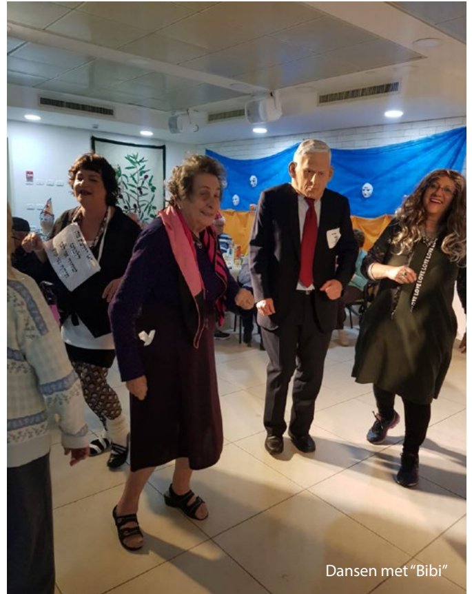
Dansen met "Bibi"

In maart bestond het 'nieuwe' Beth Joles aan Kikar Harakafot in Haifa veertig jaar; veertig is geen vijftig, maar wel een aantal van gewicht. Geen groot feest, maar toch samen met elkaar maakten we er een gezellige dag van. We zijn trots op het feit dat we in een van de eerste ouderhuizen in Israël wonen, in Haifa, met een geschiedenis, die teruggaat naar 1956. Op 20 december