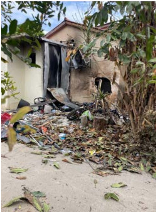
Een verwoest huis in Nachal Oz (niet het huis waar de familie Reijnen in woonde)

gebeurde toch. Terroristen drongen Israël binnen, niet via tunnels maar over en door het hek heen. Urenlang zaten we in onze 'veilige kamer' om ons te beschermen tegen raketten vanuit Gaza maar ook in de wetenschap dat we in de kamer waren waar Hamasterroristen als eerste zouden zoeken.