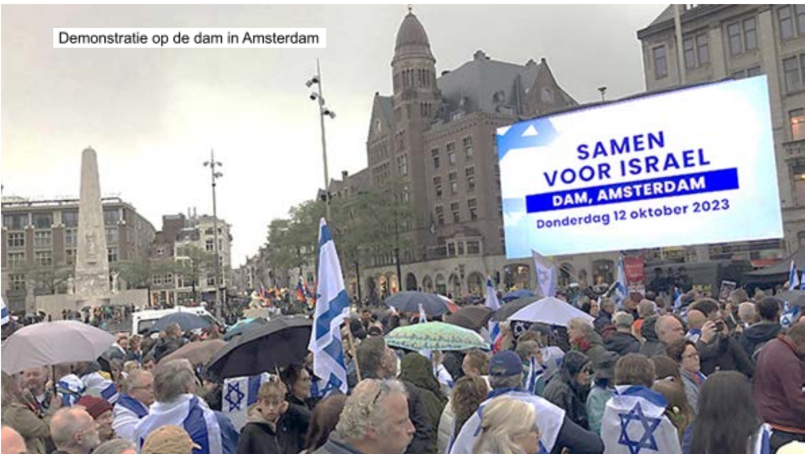
Demonstratie op de dam in Amsterdam

Voor hetzelfde doel werden er op 27 oktober op het Museumplein lege buggies met afbeeldingen van jonge gegijzelden geplaatst. Dit was op touw gezet door Israëli’s in Nederland. In Nederland woonachtige Israëlijsche