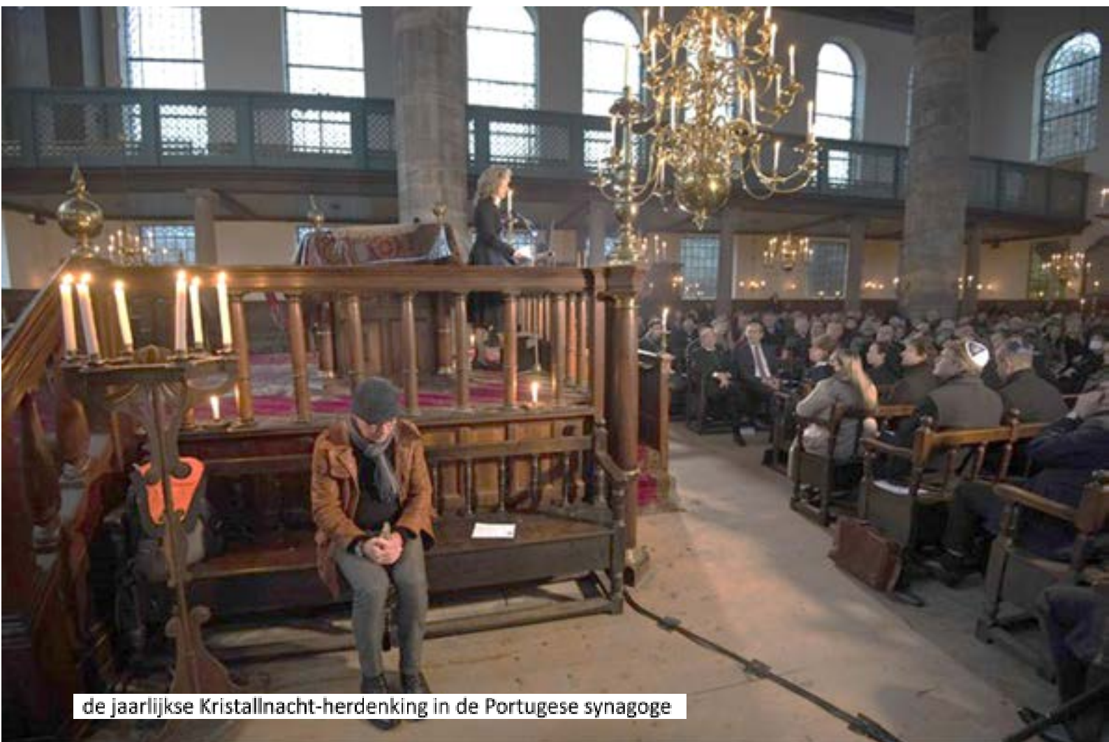
de jaarlijkse Kristallnacht-herdenking in de Portugese synagoge