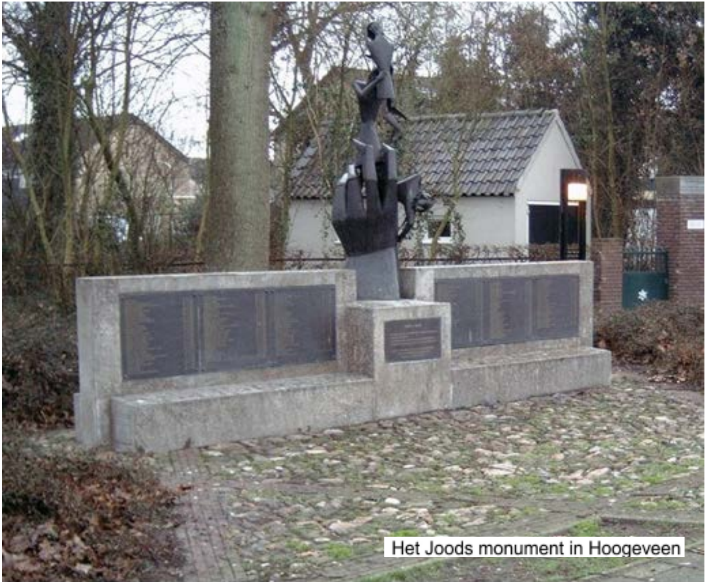
Het Joods monument in Hoogeveen

leerstoel Holocaust-educatie. De leerstoel is verbonden aan de Radboud Universiteit in Nijmegen.