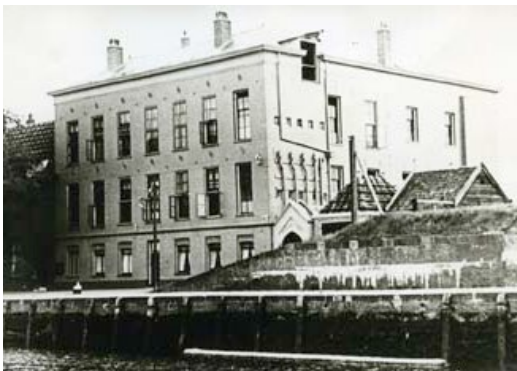
Voormalige marinierskazerne die dienst deed als vluchtelingenkamp