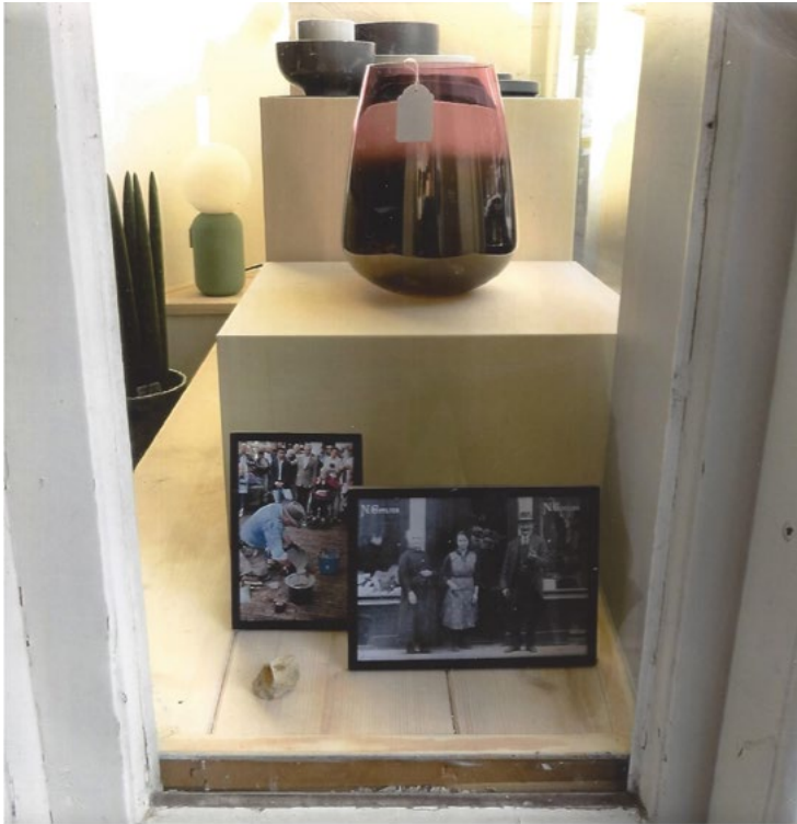
Het steentje van de Carmel in de etalage, met beide hierboven afgedrukte foto's