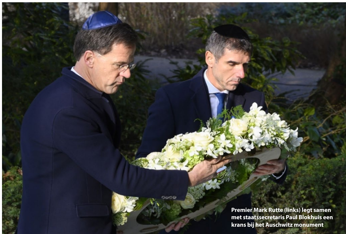
Premier Mark Rutte (links) legt samen met staatssecretaris Paul Blokhuis een krans bij het Auschwitz monument

De afgelopen maanden was er nogal wat hoog bezoek uit Nederland. Dat vindt zijn weerslag in de verslagen van de IOH-afdelingen en van 'zomaar' Nederlanders in Israël. Op de voorgaande bladzijden kwam zowel het bezoek van Koning Willem-Alexander als dat van minister Sigrid Kaag langs. Ook in Nederland was er een gebeurtenis, die grote aandacht heeft getrokken en van invloed is op onze relatie met ons land van herkomst. Eindelijk excuses voor het schromelijk falen van de Nederlandse overheid tijdens de bezettingsjaren.